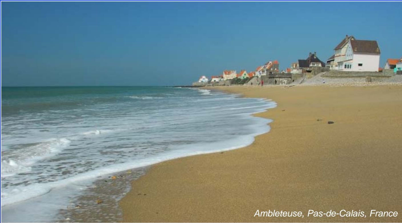
Ambleteuse, Pas-de-Calais, France